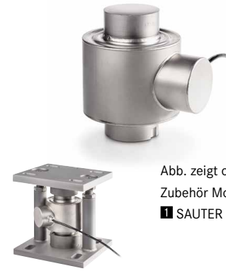
Abb. zeigt optionales Zubehör Montagekit ■ SAUTER CE P41430